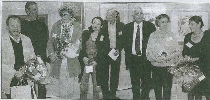
La remise des prix