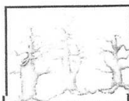
Oriane DI PASQUALE 100X80 cm